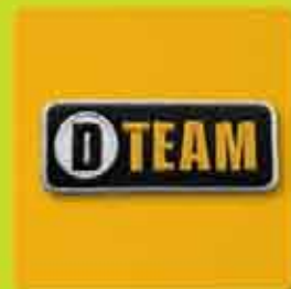
Stick-Label mit Applikationskleber C) 005/94132