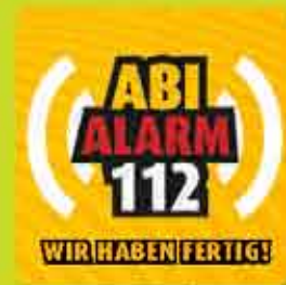
D3000-Transfer A) 005/901471/1 - B) 005/901473/1