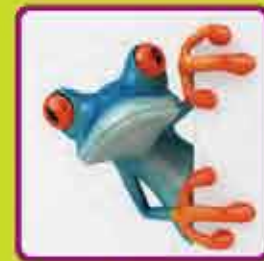
Sobli-Deck A) 005/130506/1 - B) 005/130505/1