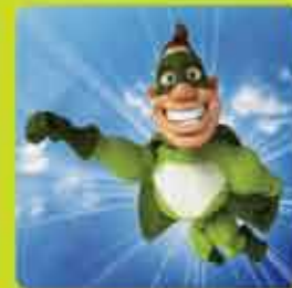
Trans-Speed A) 33/7641/1 B) 33/7642/1