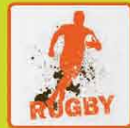
Soft-Transfer A) 005/337634/1 - B) 005/337635/1