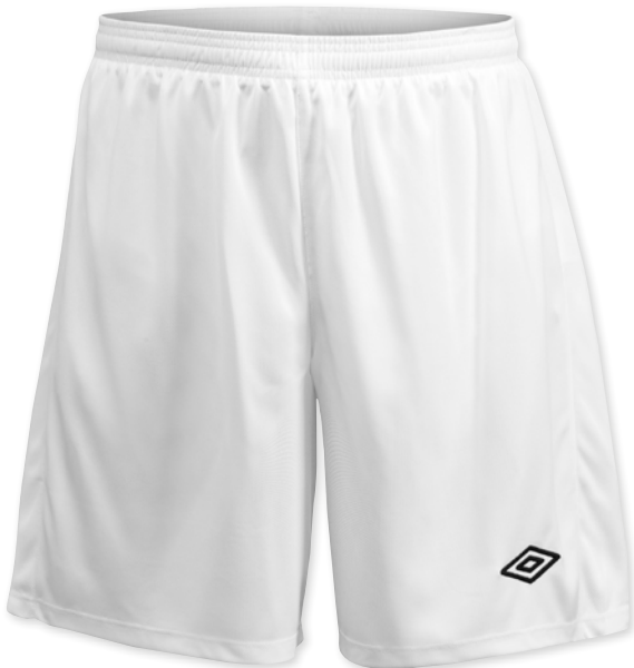
Hvid/Sort (S-XXL) 096

Shorts med meshfor i funktionelt materiale. Produceret efter Umbros Tailored By koncept. Elastik og snøre i taljen.