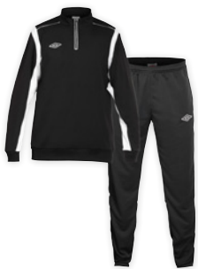
Sort/Hvid/Sort T90 XS-XXXL