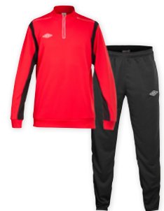
Red/Hvid/Sort U56 XS-XXXL