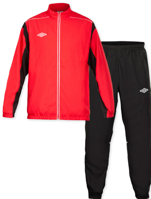
Rød/Hvid/Sort U56 XS-XXXL