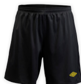
Sort/Gul (S-XXL) 7S6