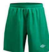
Grøn/Hvid (S-XXL) 98S