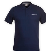
Dark Navy N84