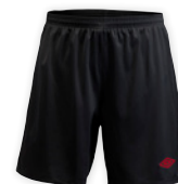
Sort/Rød (S-XXL) K95